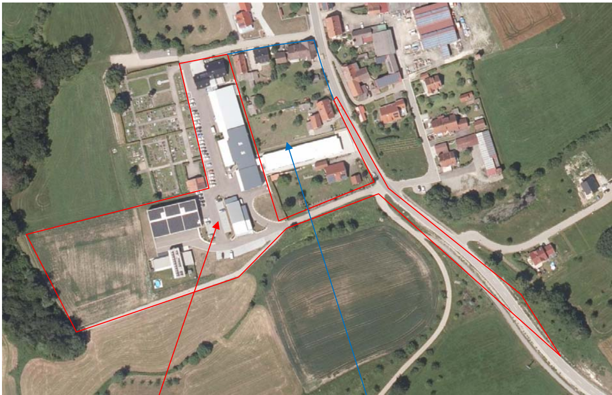
Geltungsbereich GE „Thoma Weg“ und Erweiterungsfläche

Bei den Flächendarstellungen der 4. Änderung des Bebauungsplanes „Thoma Weg“ handelt es sich um ein Gebiet, welches im rechtskräftigen FNP als Gewerbegebiet und gemischte Baufläche dargestellt ist. Die Flächen werden für Wohn-, Gewerbebauten und Gartenflächen genutzt.